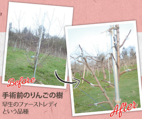
手術前のりんごの樹 早生のファーストレディ という品種

ウグイスのさえずりを聞きながら農作業が進みます。春は解放感にあふれ、何もかもが生き活きとしています。そんな中、今日の作業はりんごの樹の大手術?!です。農家の目的としては短期間に品種更新をすることにあります。たとえば、新品種の導入やこれからの経営の見直しなどです。「安心して下さい!」手術後のりんごの樹は元気です。