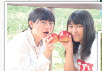
酒田の東北公益文化大学学生さん