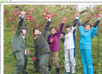
東京からの大学生収穫応援隊