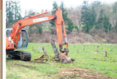
6 抜根 残った切株と根っこは、大きなショベルカーで掘り起こす。