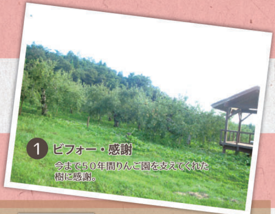
1 ビフォー・感謝 今まで50年間りんご園を支えてくれた樹に感謝。

農業は、3世代そろって皆元気な内は結構強い。しかし、1人でも欠けると途端に弱くなる。これが家族経営の難しいところ。 私たちも少しずつ増やしてきたりんご園ですが、ここに来て人手不足による悩みを解消すべく改植することに決めました。現在あるりんごの樹を切り、新たにりんごの樹を植えるという方法です。この樹が活躍する頃はまだ想像できませんが、未来のための改植です。今回はこの改植作業を紹介します。