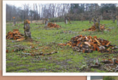
5 うーん・・・ 畑の変わりようにちょっとさびしいさが・・・