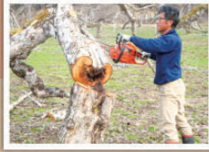
3 伐採 チェーンソーで幹から倒し、45cmの駒切りにする。