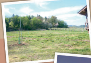
10 アフター・希望 これからの50年、いや100年・・・