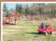
7 後片付け 根っこは地上部の枝と同じ広さに四方八方に元気よく伸びている。細かい根っこまできれいに拾う。

11 大安吉日 Even if I knew that tomorrow the world would go to pieces, I would still plant my apple tree. Martin Luther たとえ明日世界が滅亡しようとも、今日私はりんごの木を植える。