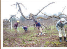
2 枝切り 太い枝は残し、細い枝を手鋸で切り落とし片づける