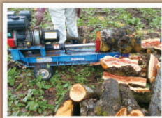
4 薪割り 冬は必ず来る！エンジン付き油圧式薪割り機は力強い。