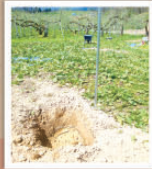
8 支柱設置と植穴掘り 植栽場所を決め、苗木を支える支柱と植穴を用意。